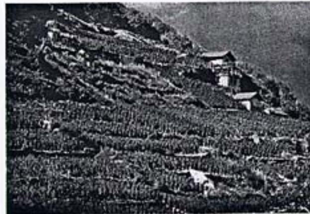
Un vignoble suisse près des Alpes.

Suisse a beaucoup de vignobles sur aux pieds des Alpes.