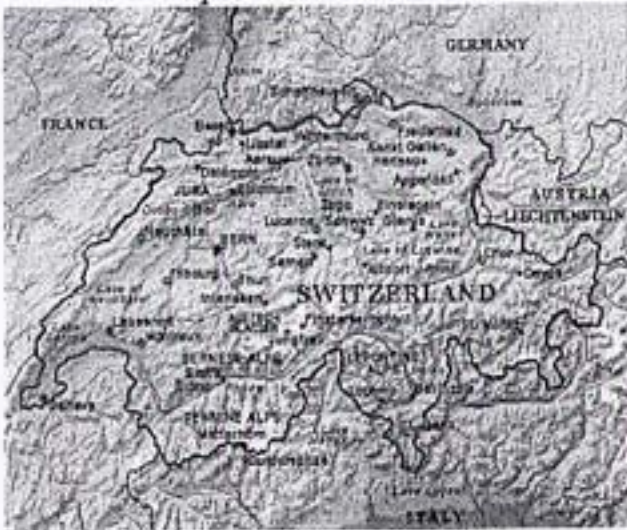
Une carte de Suisse en anglais

Est-ce que vous aimez faire la connaissance de nouvelles personnes ?